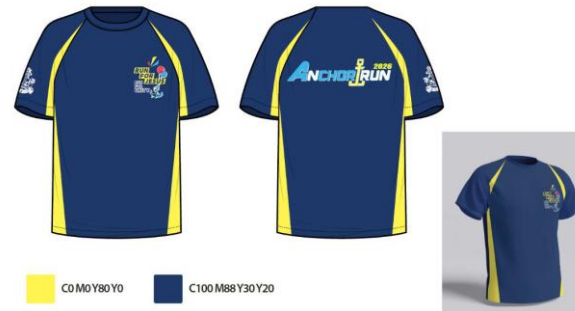
紀念 T 恤